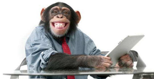
Cette semaine à Rock Classique...